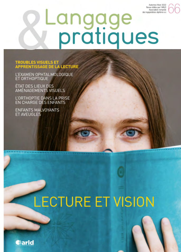
Couverture de la revue Langage et pratiques n° 66

plus large aux difficultés rencontrées par ces personnes et à mettre en avant le travail des professionnel-le-s de la logopédie. Pour la première année, les troubles suivants ont été illustrés : les troubles d'acquisition, la dyslexie, le bégaiement, l'aphasie et la dysphagie pour aller dans le sens du thème proposé soit « la logopédie tout au long de la vie ». Ce projet est déclinable et peut être reconduit pour augmenter le nombre de ressources disponibles sur le site.